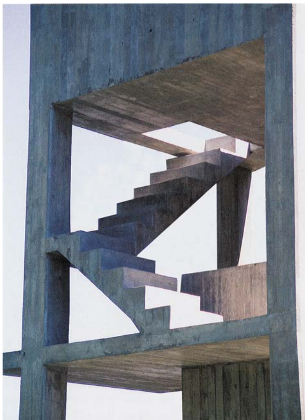
Figura 3 – Pedro Cabrita Reis, pormenor do Monumento a Azeredo Perdigão , Jardim Gulbenkian, 1997

Dimensione o seu trabalho de acordo com o espaço da folha de prova e o meio actuante escolhido.